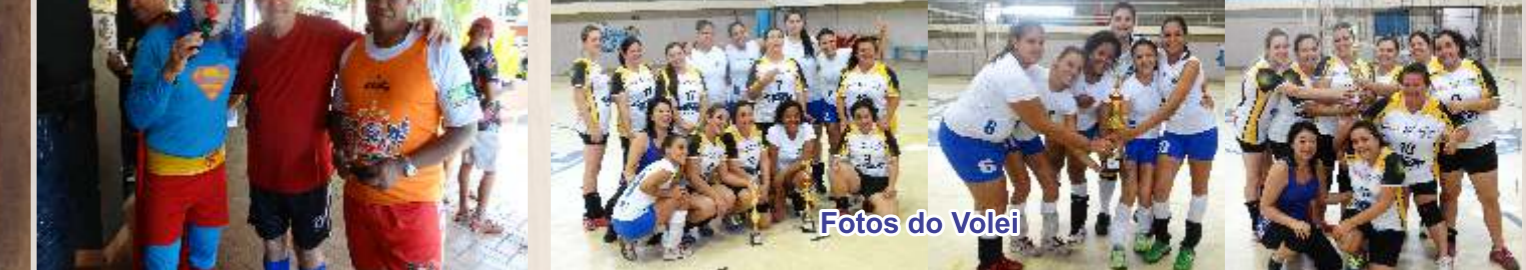
Fotos do Vôlei

Nas outras áreas do Clube, houve disputas nas modalidades de basquete, malha, snooker, tênis e vôlei.