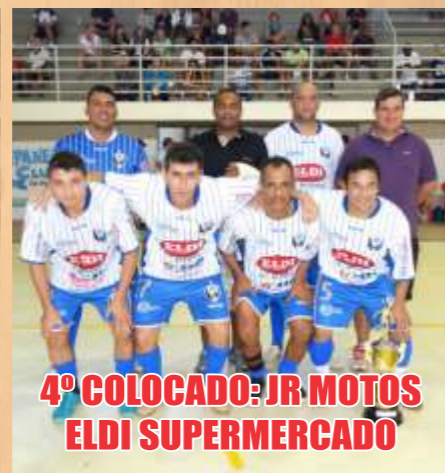
4º COLOCADO: JR MOTOS ELDI SUPERMERCADO