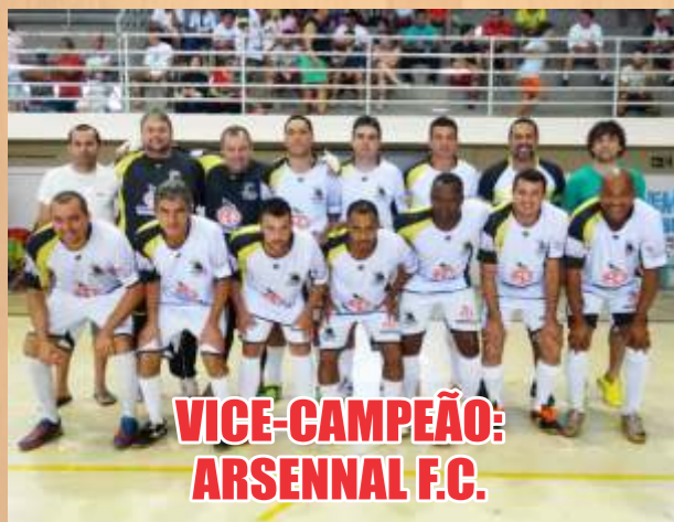
VICE-CAMPEÃO: ARSENAL F.C.