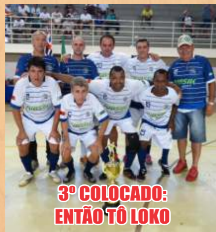
3º COLOCADO: ENTÃO TÔ LOKO