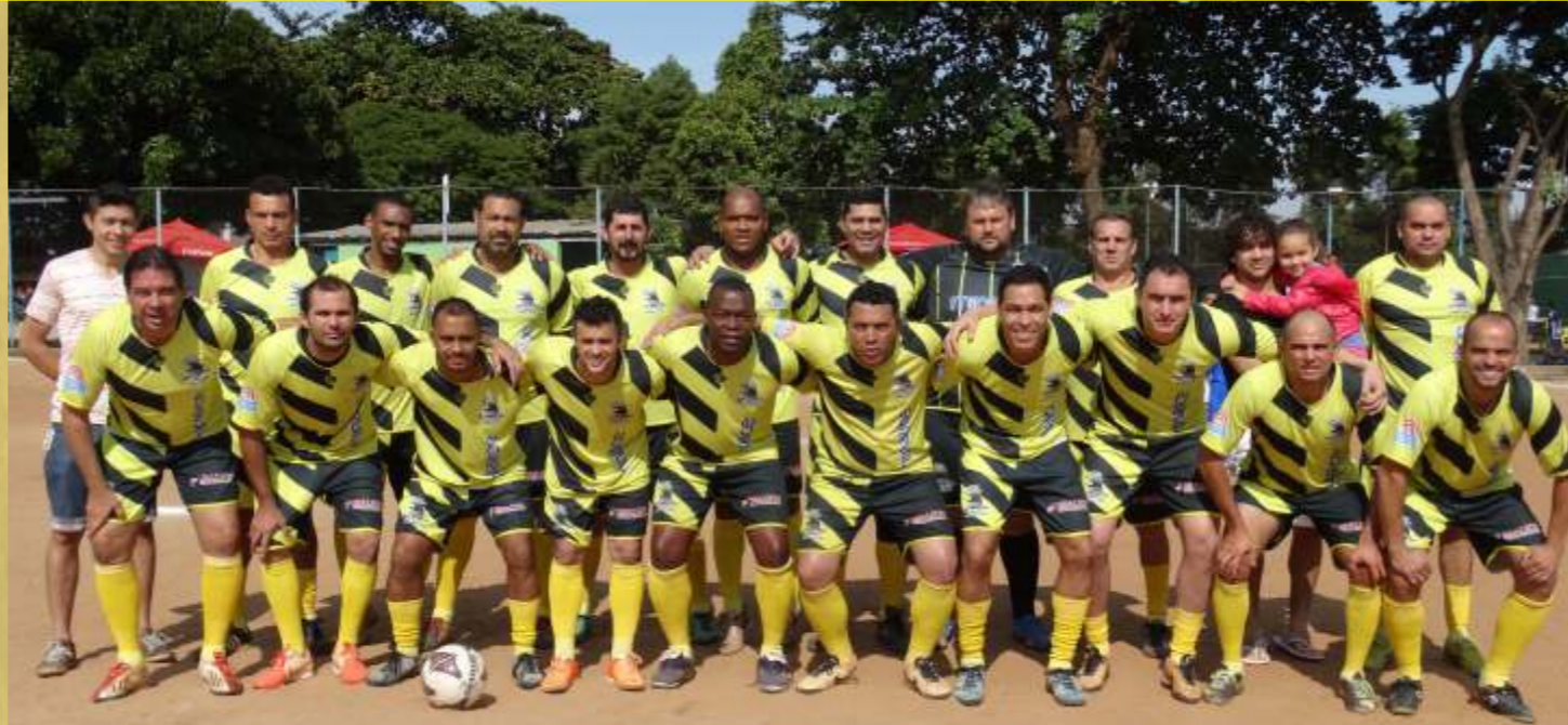
VICE-CAMPEÃO: REAL MADRID/EMAT/LUCREMI